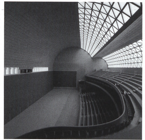
FRONTÓN RECOLETOS EN MADRID (SECUNDINO ZUAZO Y EDUARDO TORROJA, 1935)