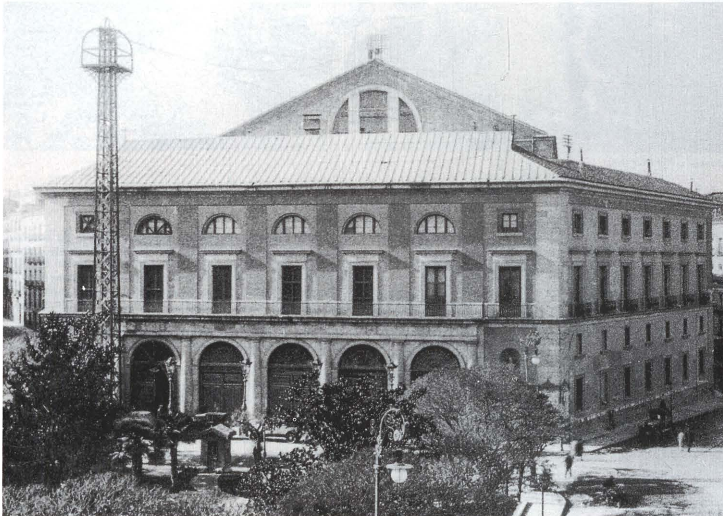
Estado de la fachada de Isabel II antes de su clausura en 1926. Hasta la fecha había sufrido pocos cambios.

El lugar que ocupa el actual edificio ha sido dedicado a teatro desde hace más de dos siglos. La historia comienza cuando, en 1704, vino a establecerse una compañía italiana en el lugar conocido como los Lavaderos de los Caños del Peral. Cuatro años más tarde, en 1708, Francisco Bartolí levantó en este mismo solar una modesta fábrica para la compañía italiana que dirigía. En aquel momento, la mayoría de los teatros eran construidos por los responsables de las compañías y los gastos sufragados por sus miembros. En 1737, se construye el famoso Coliseo de los Caños del Peral del que tenemos numerosas noticias hasta su desaparición, en 1817.