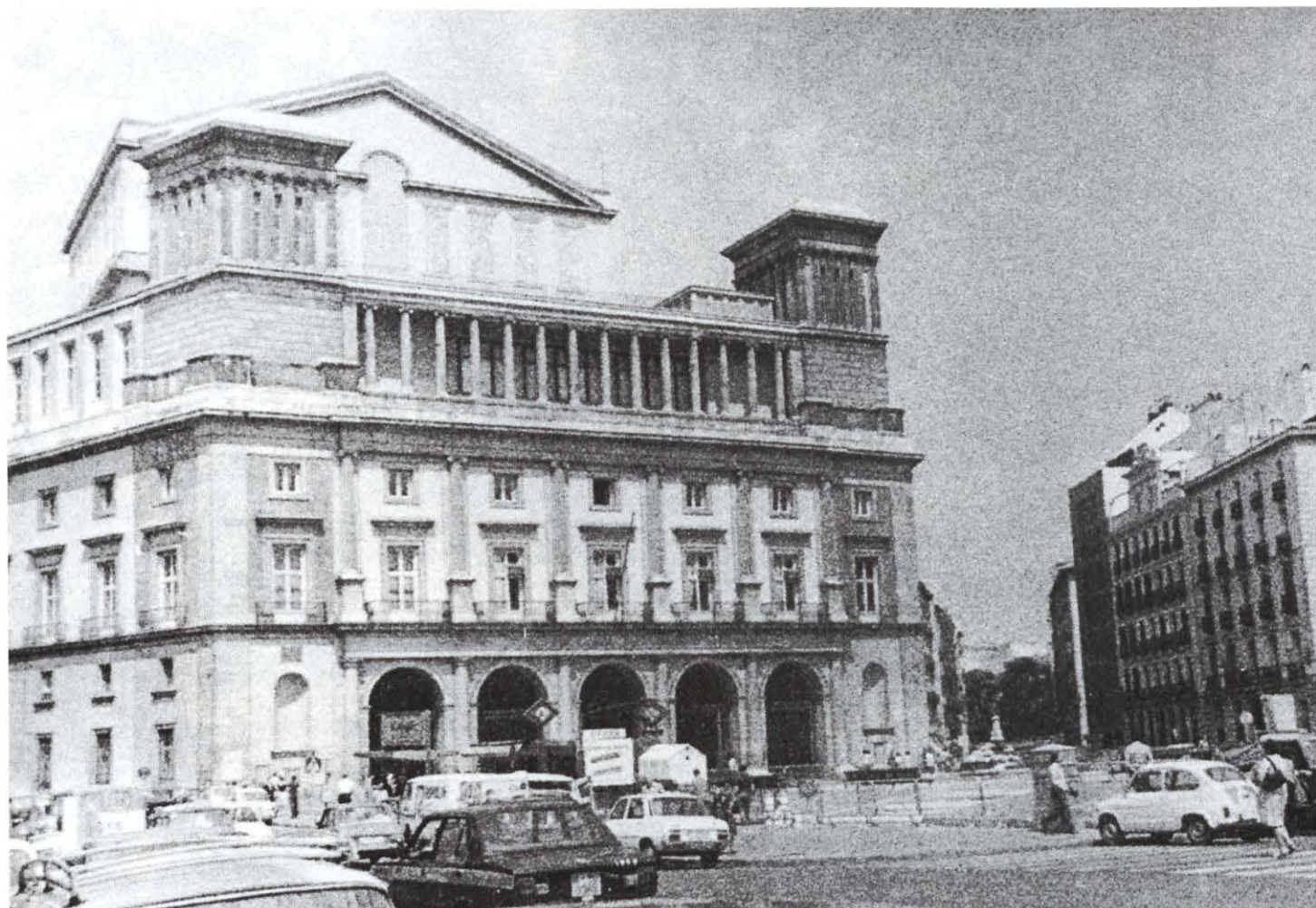
Estado de la fachada de Isabel II después de la remodelación del año 1966.

y proyecta la fachada de la plaza de Isabel II y el interior del edificio. La planta, muy forzada por el solar que ocupa, tiene un complicado perímetro en forma de hexágono irregular. Esto obligó al arquitecto a articular la sala y el escenario de tal manera que eran muchos los espacios sin uso determinado y difícil su circulación. No olvidemos que la entrada de la Plaza de Oriente era para uso exclusivo del monarca y su séquito, y que el acceso del público se hacía por la Plaza de Isabel II, lo que obligaba a los espectadores a recorrer interminables pasillos y escaleras. A pesar de los inconvenientes del solar, el edificio cumple los esquemas del teatro que surge del debate entre Italia y Francia sobre el carácter de la nueva tipología arquitectónica y que se desarrolla en toda Europa a lo largo de los siglos XVIII y XIX. Al mismo tiempo responde a las ideas que recoge Blondel, en el segundo volumen de su "Cours d'Architecture", publicado en 1771, en el que recomienda que los teatros sean edificaciones aisladas con acceso fácil para los coches de caballos y arcadas exteriores para tomar el aire.