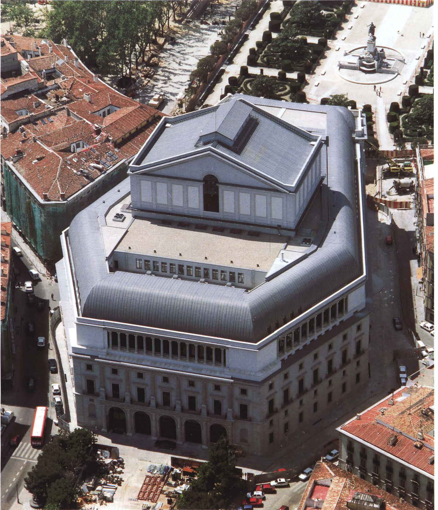
Estado de la cubierta despues de la remodelación de 1996