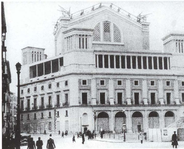
Obras en la fachada y la cubierta de la plaza de Isabel II. 1943

La idea de Isidro González Velázquez fue la de construir una plaza monumental delante del Palacio de Oriente, ante la necesidad de urbanizar esta zona después de los derribos realizados en 1810 por José Bonaparte. El proyecto de Velázquez responde a una plaza circular que rompe con la tipología tradicional de planta rectangular, abierta hacia la fachada del palacio y formada por una planta porticada, un entresuelo y una planta noble. Dentro de todo este conjunto diseña la fachada del nuevo teatro, creando un cuerpo bajo ligado al resto de las edificaciones que conforman el espacio y situándolo frente a la fachada del palacio y sobre el mismo eje, manteniendo así la idea de Sachetti.