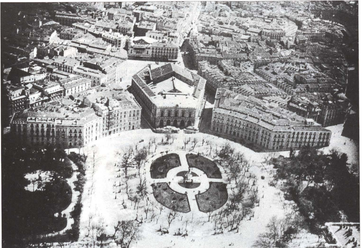
Vista aerea del Teatro Real. 1935.