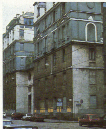
Vista de la fachada noreste.