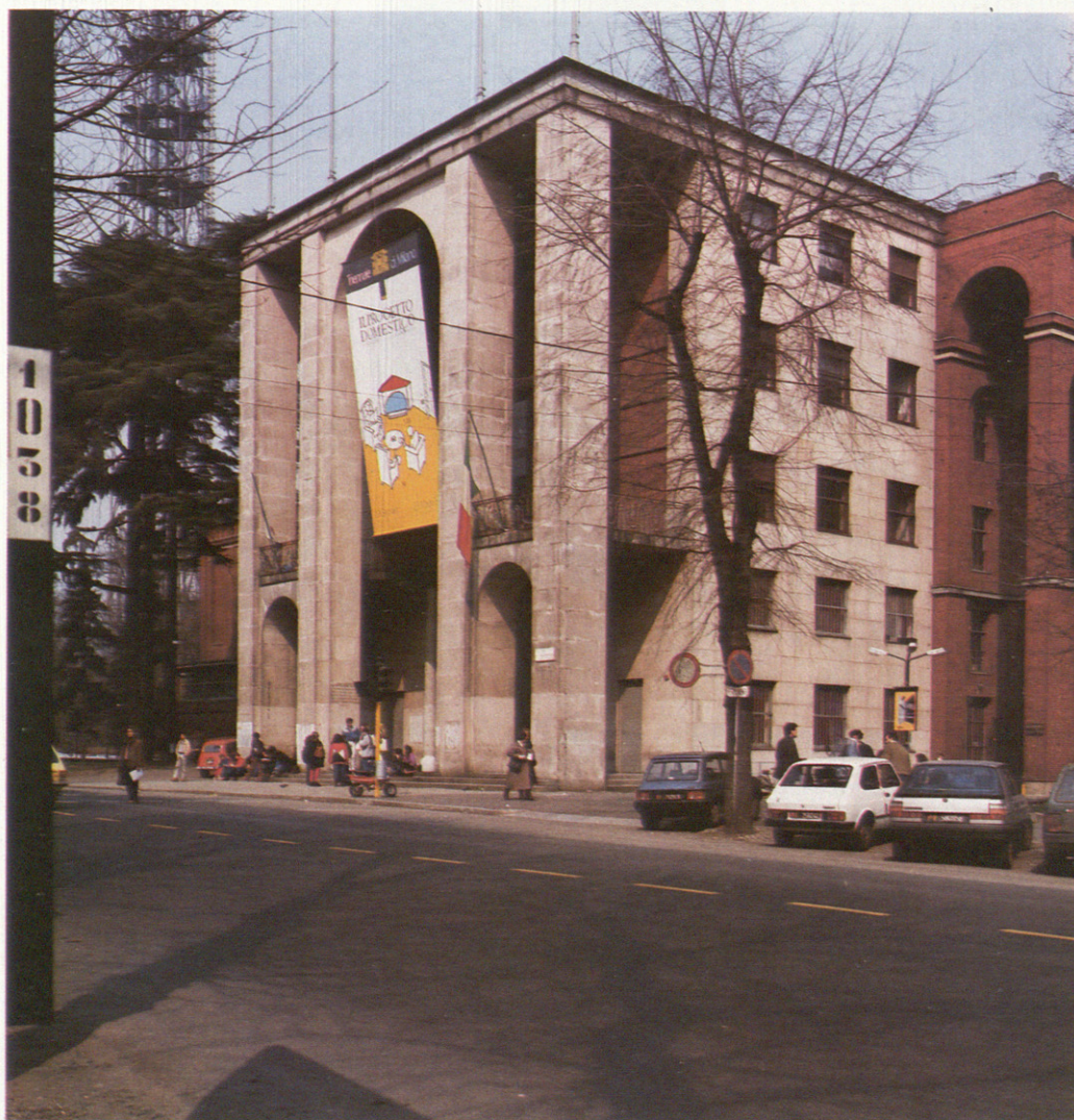
Entrada del Palacio de la Trienal.