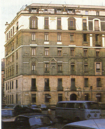
Esquina del ala norte.