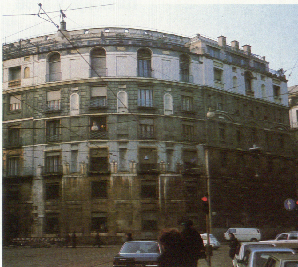
A la izquierda, Ca Brutta, vista de la esquina a las calles Moscova y Turati. Abajo, planta.