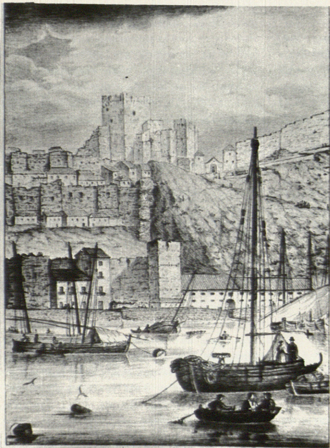
Vista del Homenaje de la Alcazaba de Málaga vista desde la Marina

los restos del teatro, para cuya gradería se aprovechó, como para todos los romanos españoles, la ladera de una colina, en Málaga la occidental de la Alcazaba, con economía notable respecto a los levantados en las otras regiones del vasto imperio.