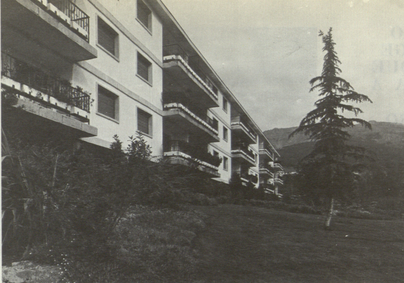
Dos aspectos de la urbanización "Los Escoriales" y vista aérea del conjunto, con el Monasterio al fondo.