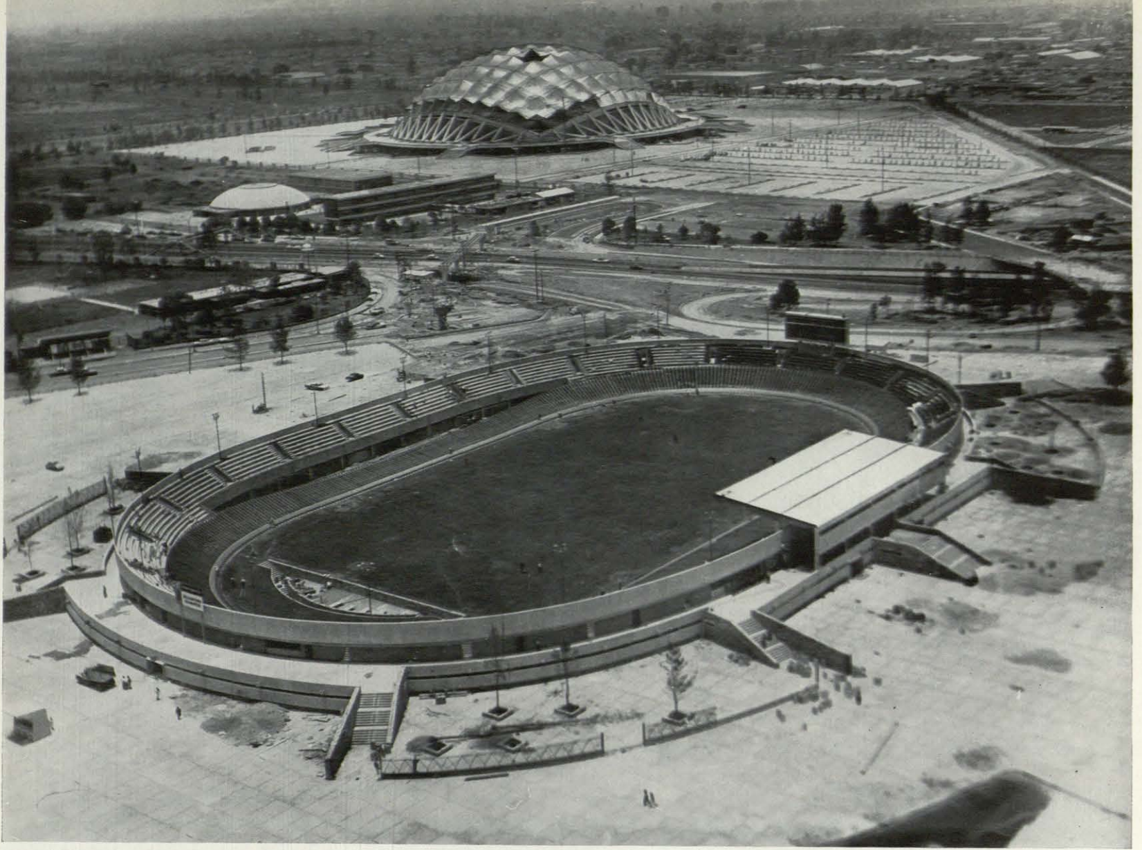
DISTINTOS ASPECTOS DEL VELODROMO OLIMPICO, EN OBRA.