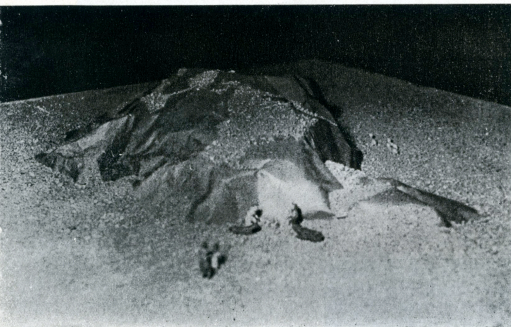
Detalles del Belén creado por el arqui- tecto Sánchez de Leva.