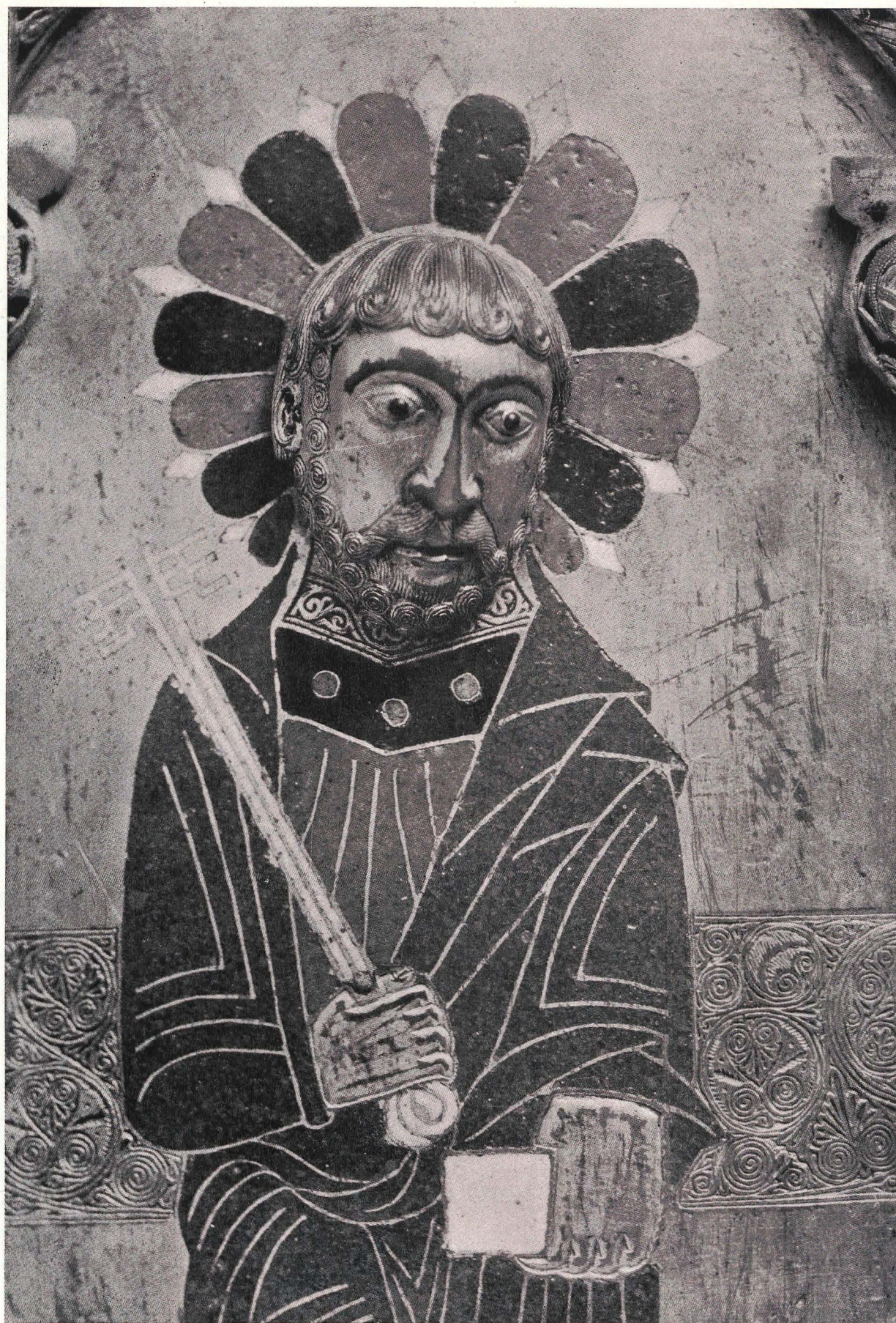
Detalle de los Apóstoles del Frontal de Silos.