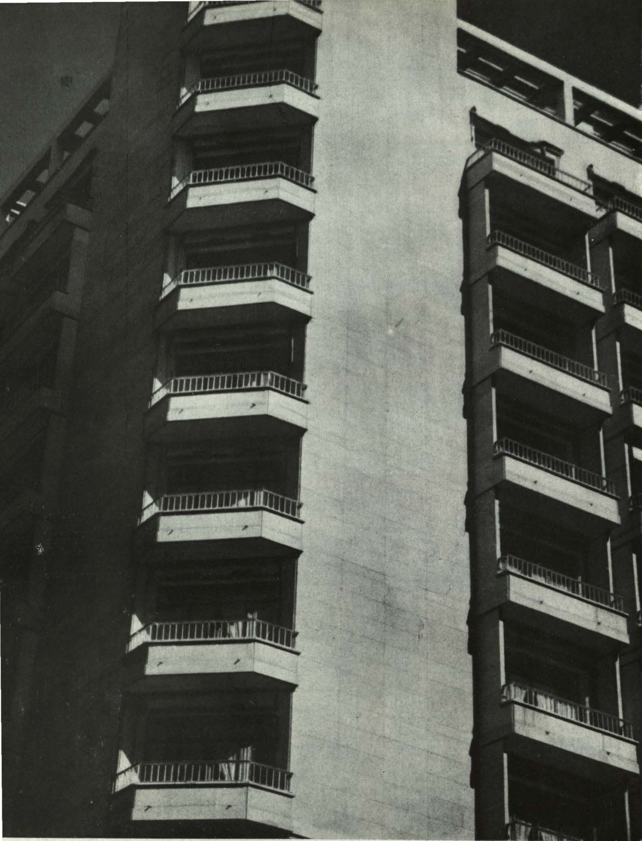
Hotel Menfis. Pormenor del chaflán de fachada.