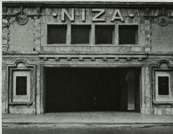
Detalles de la sala y fachada.