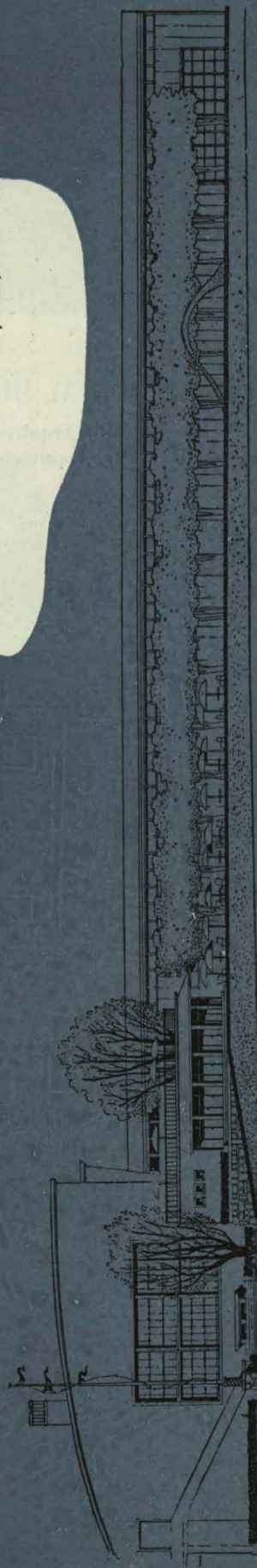
Fachada al Sena. A la izquierda, el edificio de la piscina de invierno y el bar. Al fondo, los vestuarios.