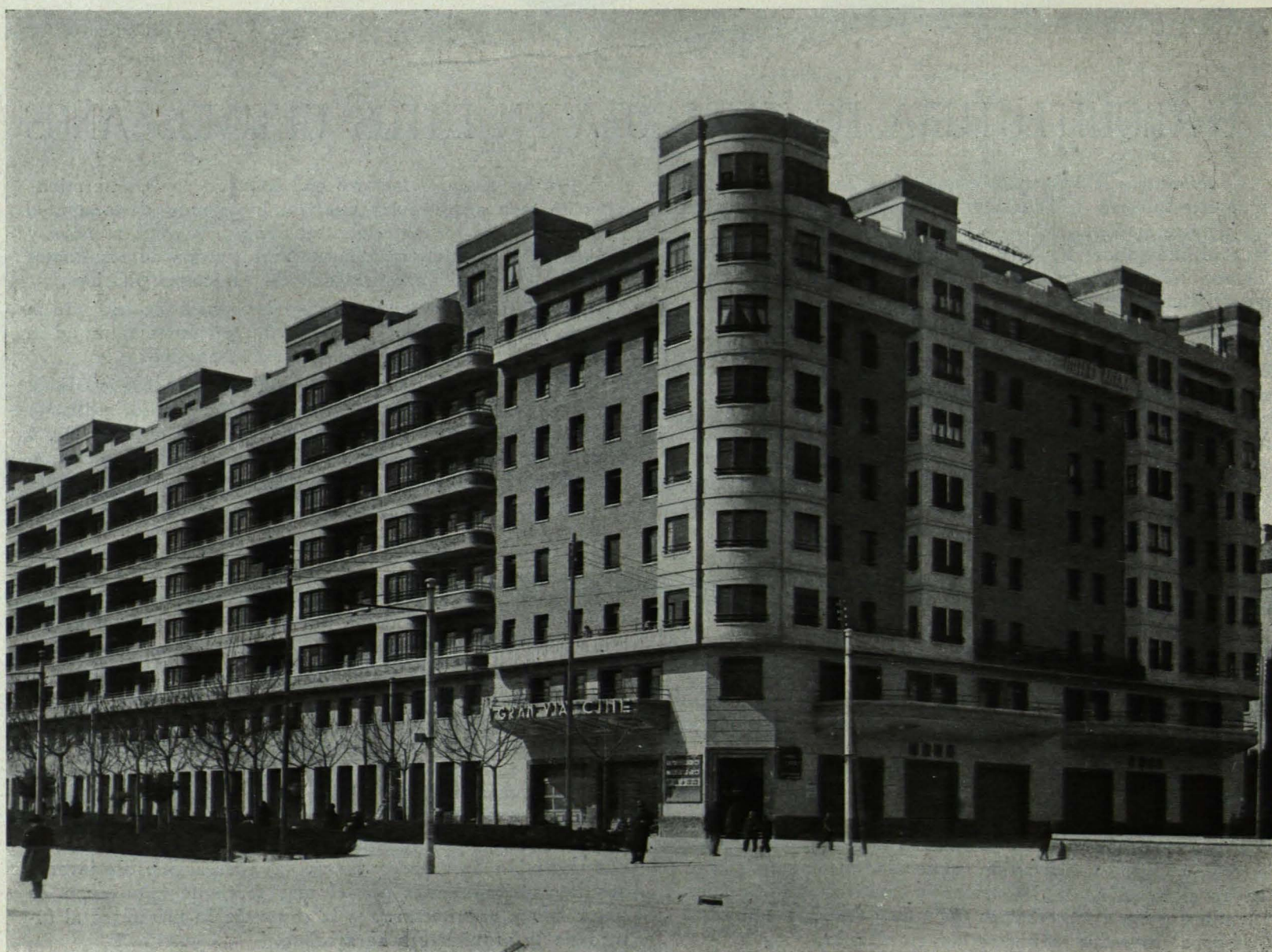
Manzana 2 de la Zona 1.ª de Ensanche. Aspecto parcial de la obra ejecutada.

Arquitectos: Miguel Angel Navarro José Luis Navarro Anguela