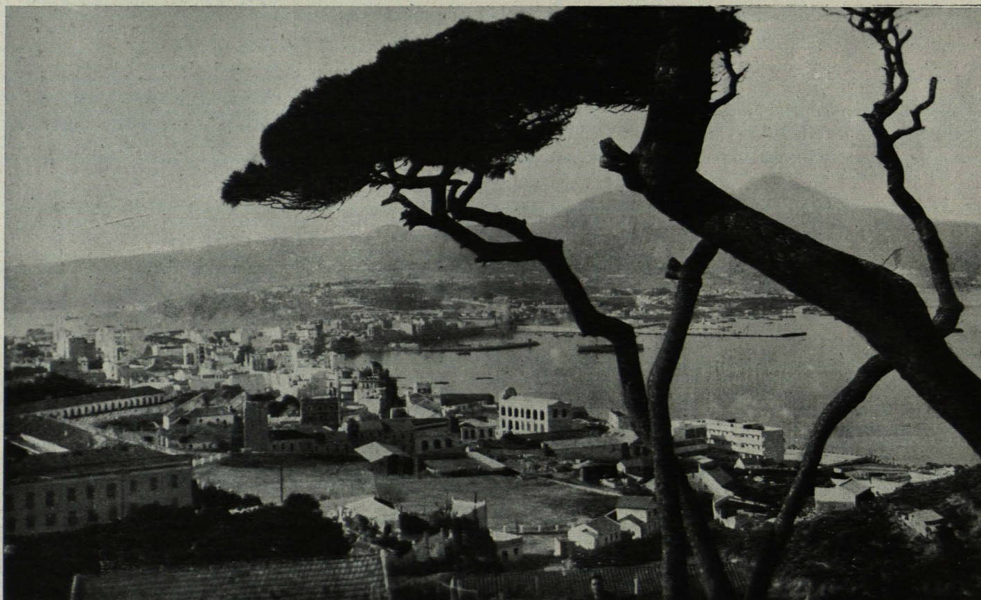
Otra bella vista de la bahía, contemplada también desde el Monte Hacho.