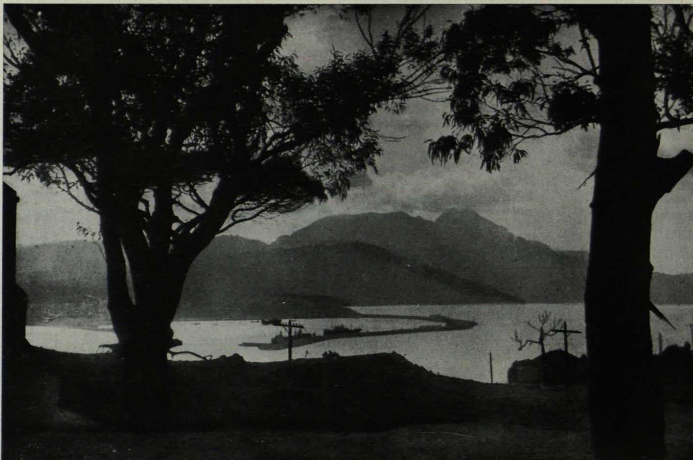
Aspecto que ofrece la bahía de Ceuta vista desde el Monte Hacho.