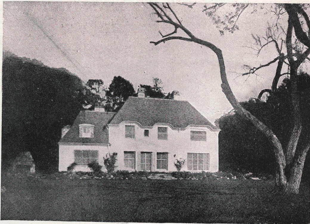
Frente hacia el río.