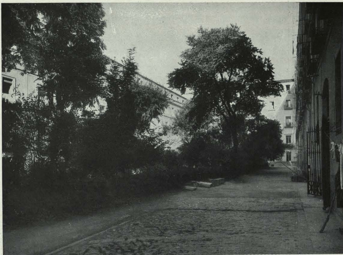
Espacio libre interior de la manzana de Castro. Casa de la calle de Serrano.