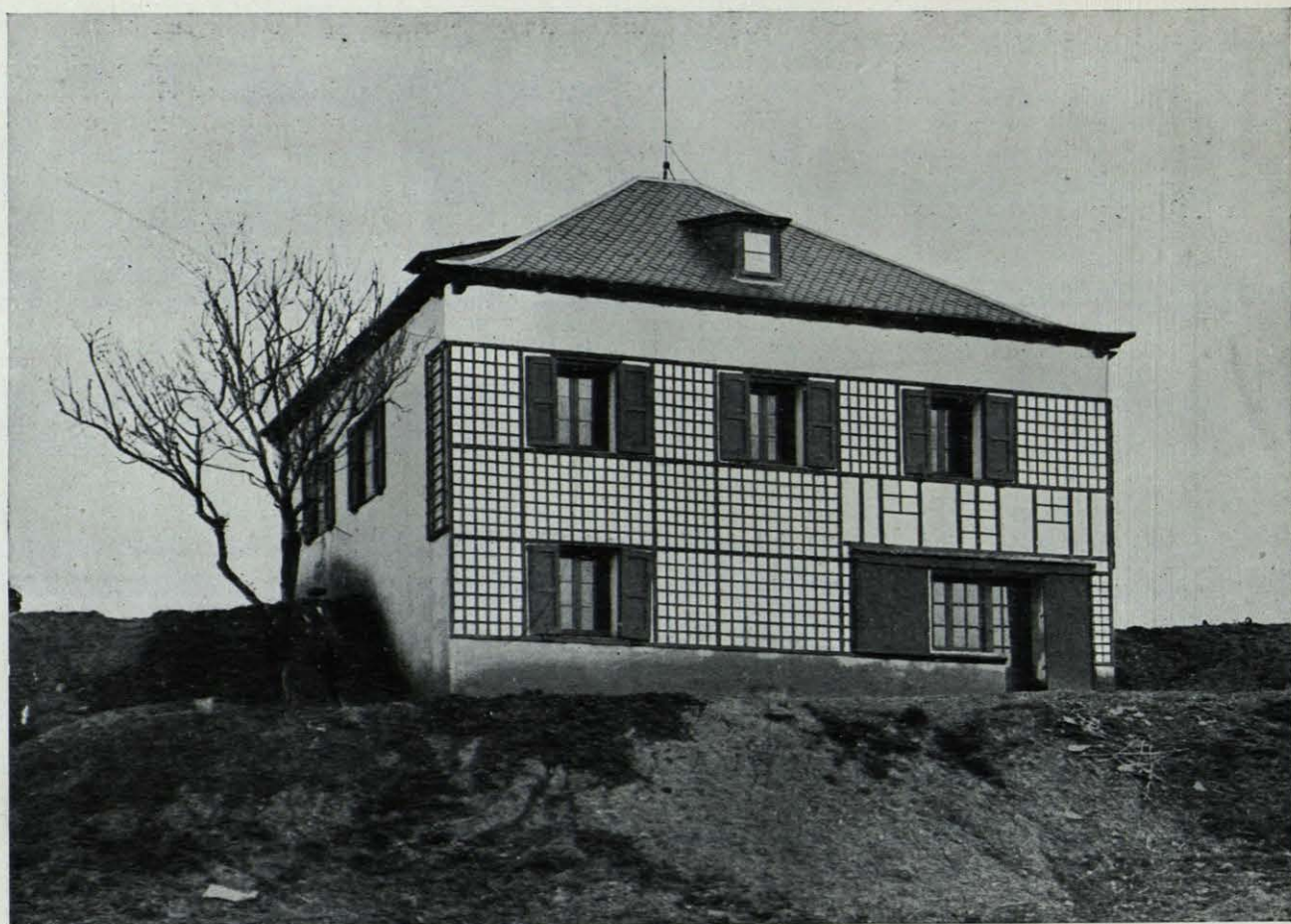
Casa labrada para sí en Ardoncino, provincia de León.