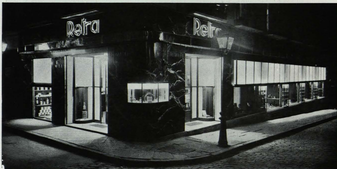
"Retra", S. A. Droguería y Perfumería.