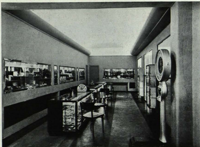
Interior de la Perfumería.