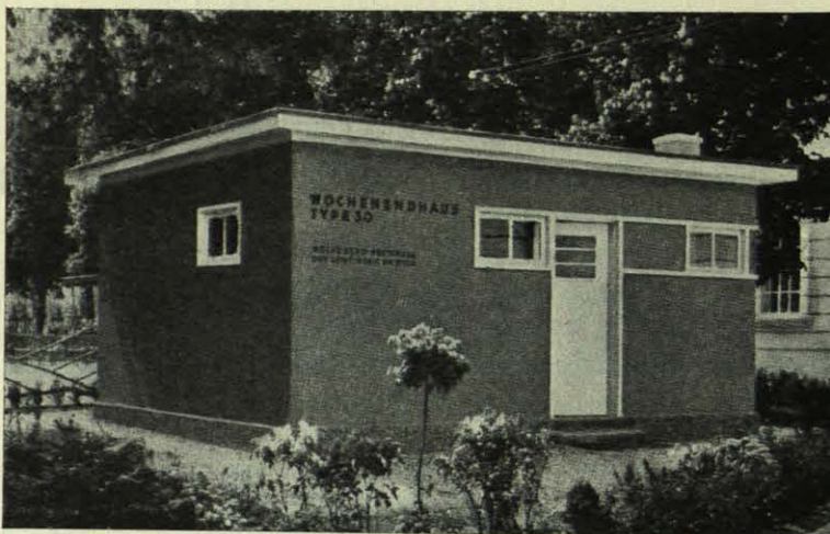
SOMMER - UND FERIENHAUSER, WOCHENENDHAUSER , por el arquitecto Johannes Bartschat . Berlín.