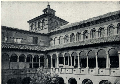
ZARAGOZA.—PATIO DEL CONVENTO DE SANTA FE (DETRUIDO).

les, un poco deformados, como fatigados de tan continuado esfuerzo, dibujan hoy día semicírculos perfectos. En resumen, el viejo claustro, pintoresco y gastado por su larga existencia, aparece hoy renovado: perfectamente a plomo sus columnas, con sus líneas horizontales y verticales impecables, como acabadas de trazar, y casi todas sus piedras de color claro, recién sacadas de la cantera.