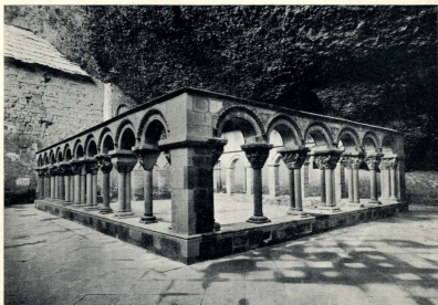
EL CLAUSTRO DE SAN JUAN DE LA PEÑA DESPUÉS DE LA RESTAURACIÓN