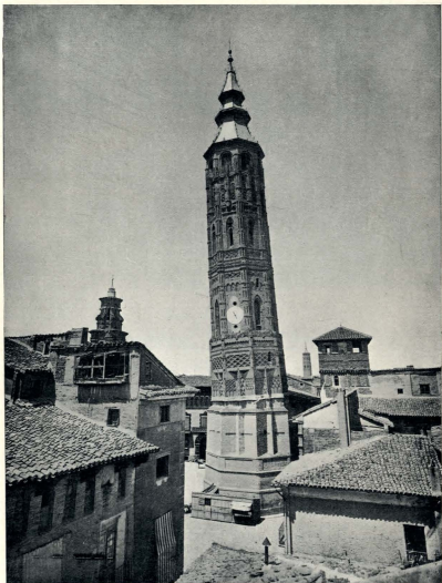
ZARAGOZA.—LA TORRE NUEVA O TORRE INCLINADA (DERRUIDA).