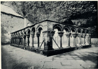
EL CLAUSTRO DE SAN JUAN DE LA PEÑA ANTES DE LA RESTAURACIÓN.