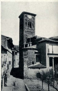
DAROCA.—IGLESIA, DERRUIDA, DE SANTIAGO.

No se hizo así, por desgracia. Con excelente voluntad, pero deplorable orientación, el claustro ha sufrido radical renovación, siendo totalmente desmontado. Muchos sillares labráronse de nuevo o se sustituyeron por otros, bastantes fustes son también modernos y sufrieron un raspado que les hizo perder su entonación secular. Las basas, desgastadas y viejas, aparecen hoy con sus molduras perfectas y sus aristas vivas, como recién torneadas. Los arcos, de dovelas desigua-