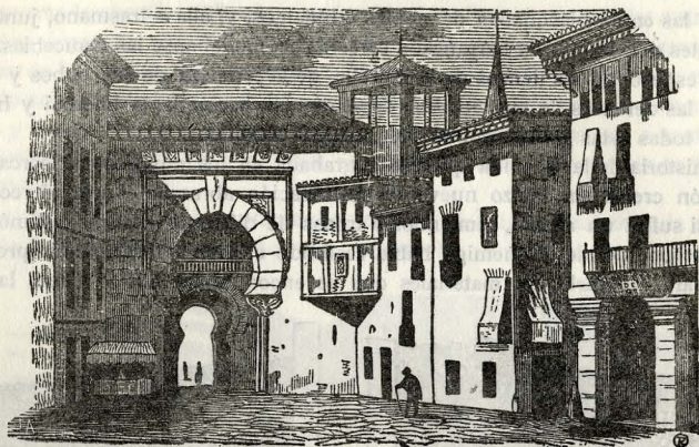
Puerta derruida de Bib-Rambla, en Granada.