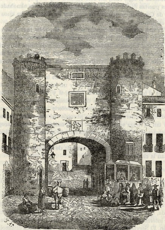
Arco derruido de Toledo, en Zaragoza.

sus restos en el Museo Provincial, merced al celo de la Comisión de Monumentos, y el arco de Toledo, destruido por acuerdo municipal en 1842 (1), por su «aspecto ruinoso», arco de ladrillo con dos grandes torreones, situado en el mercado y plaza