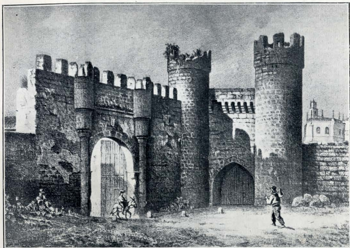
PALENCIA. — PUERTA DE MONZÓN, SEGÚN UN DIBUJO DE PARCERISA.