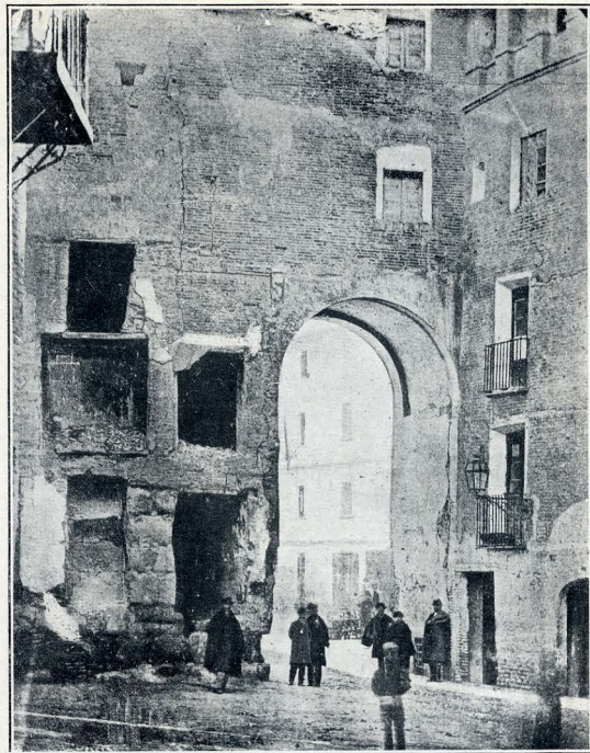
ZARAGOZA. — ARCO DE VALENCIA (DEL LADO DE LA CIUDAD).