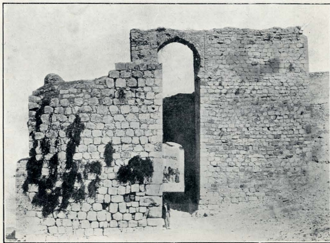
JAÉN. — LA PUERTA DE MARTOS.