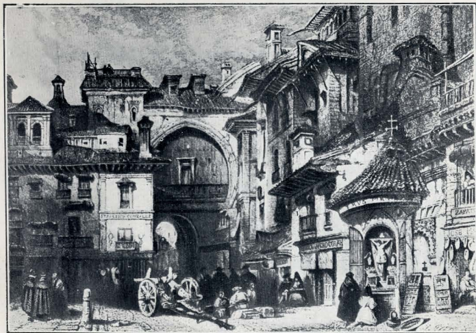
GRANADA. — PUERTA DE BIBARRAMBRA, SEGÚN UN DIBUJO DE P. DE VILLA AMIL.