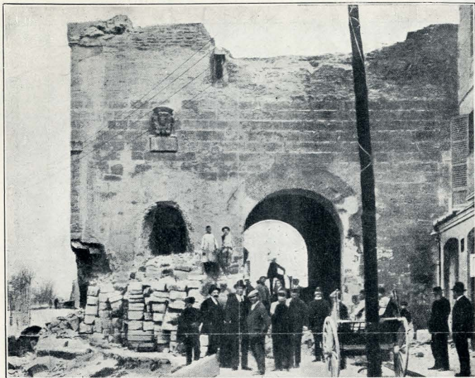
PALMA DE MALLORCA. — LA PUERTA DE SANTA MARGARITA AL COMENZAR SU DERRIBO.