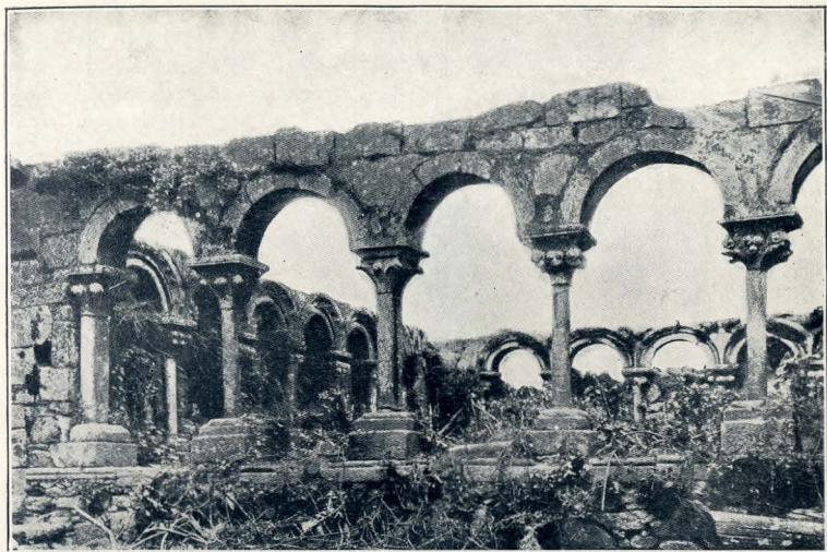
CLAUSTRO DEL MONASTERIO DE TOJOSOUTOS (LA CORUÑA).