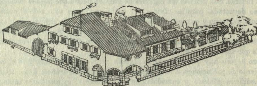
Posada en los Vosgos. Arquitecto: Paul Hüllard.