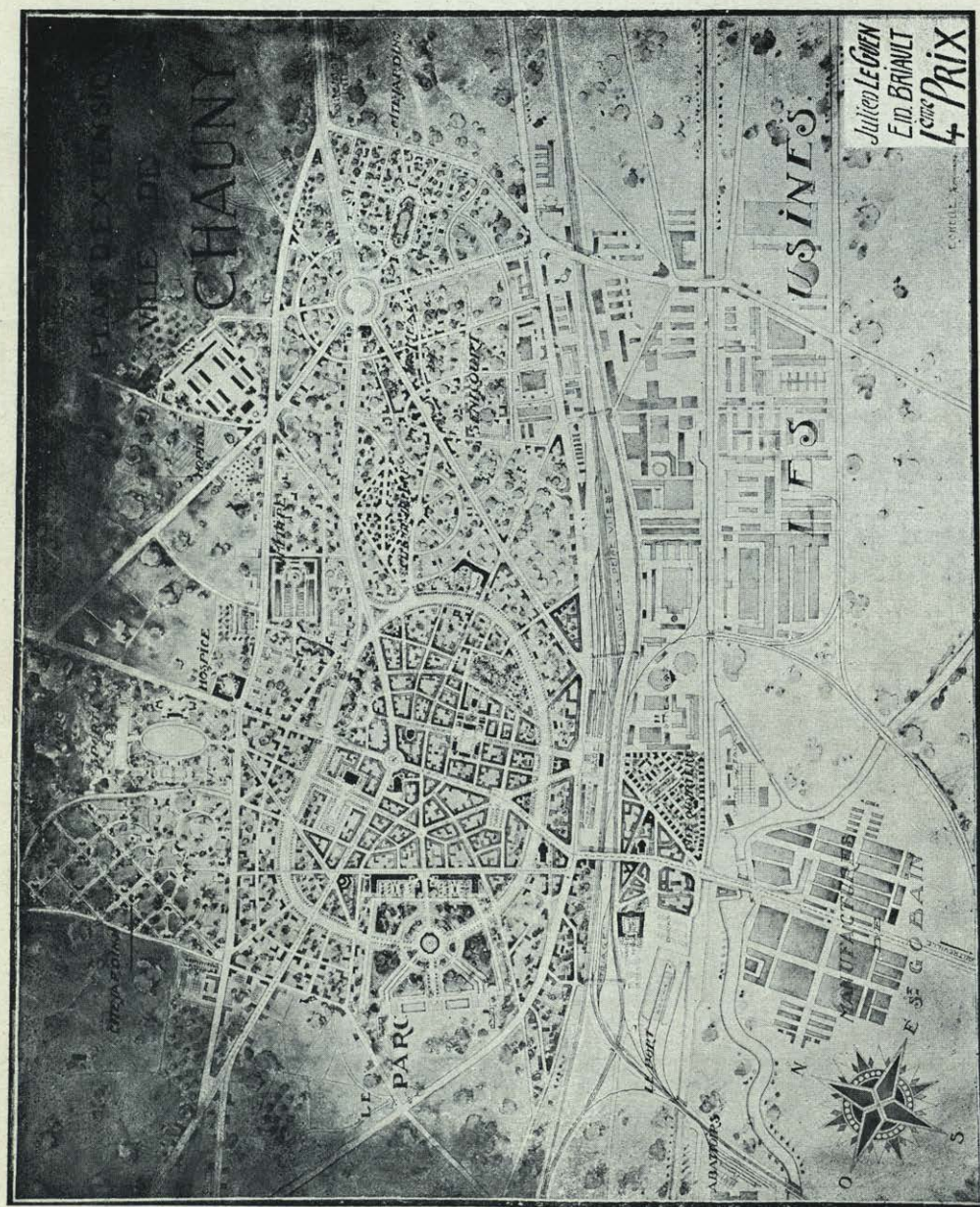
PROYECTO DE RECONSTITUCIÓN DE CHAUNY.

ARQUITECTOS: JULIEN L. GUEN Y EDM. BRIAULT.