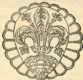
El lirio rojo.—Emblema de Florencia. (De un medallón de Della Robbia).