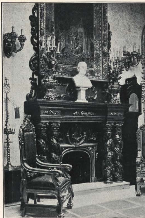
CHIMENEA DEL SALON