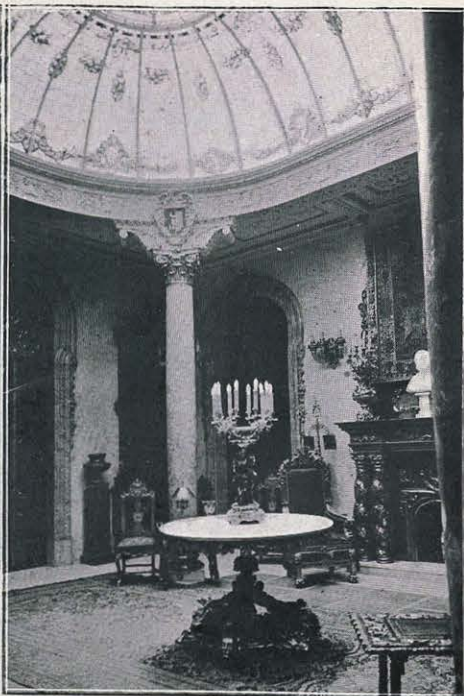
ÁNGULO DEL SALÓN

PALACIO PROPIEDAD DEL SEÑOR CONDE DE LA REVILLA, EN EL NÚMERO 9 DE LA CALLE DEL ARENAL EN MADRID.