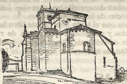
Zorita del Páramo. — Exterior de la Iglesia.

El tejado se ha convertido en terraza, haciendo en ella un jardín, del cual publicamos una fotografía.